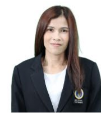
กรรมการและเลขานุการ