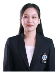
ผู้ช่วยเลขานุการ