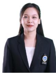
ผู้ช่วยเลขานุการ