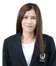
กรรมการและเลขานุการ