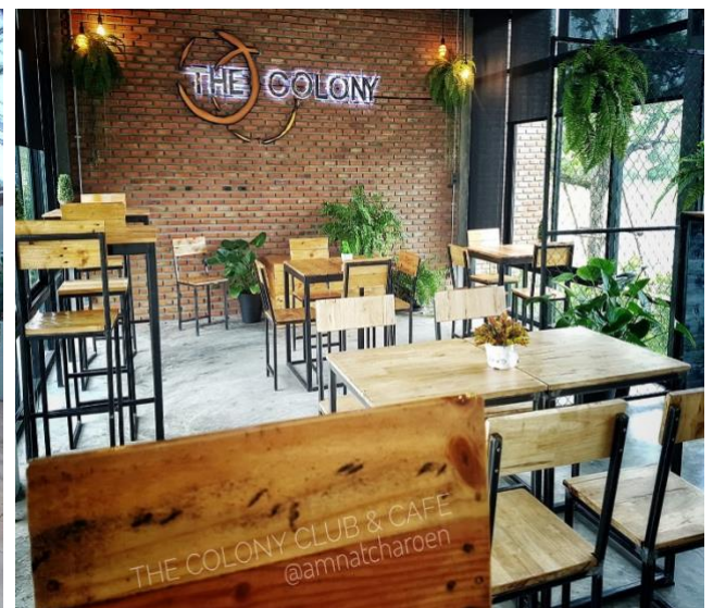
ร้าน The Colony ถนนเลี้ยวเมือง มีสนามบอลหญ้าเทียมให้บริการ