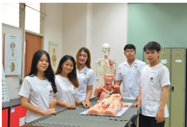
ชุดเสื้อกาวน์คอกลม และคอปก

(๒) ฝึกปฏิบัติการสาธารณสุขชุมชน เนื่องจากเป็นการฝึกปฏิบัติงานในชุมชน นักศึกษาสามารถใส่ชุดสุภาพ รองเท้าผ้าใบ หรือรองเท้ายาลงได้ ไม่นอญาติให้ใส่รองเท้าแตะในวันที่จัดกิจกรรมประชาคม ประชุมร่วมกับชุมชน หน่วยงานในพื้นที่