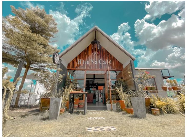
ออกนอกตัวเมืองไปก็มีคาเฟ่บรรยากาศดี ๆ ที่ Himna