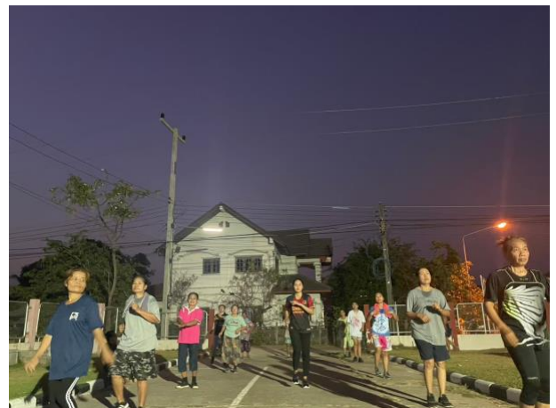
ชุดสุภาพในการทำกิจกรรมร่วมกับชุมชน