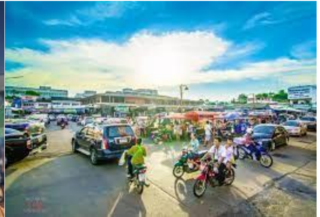
ตลาดไต้รุ่งเรียงข้างที่ว่าการอำเภอเมือง