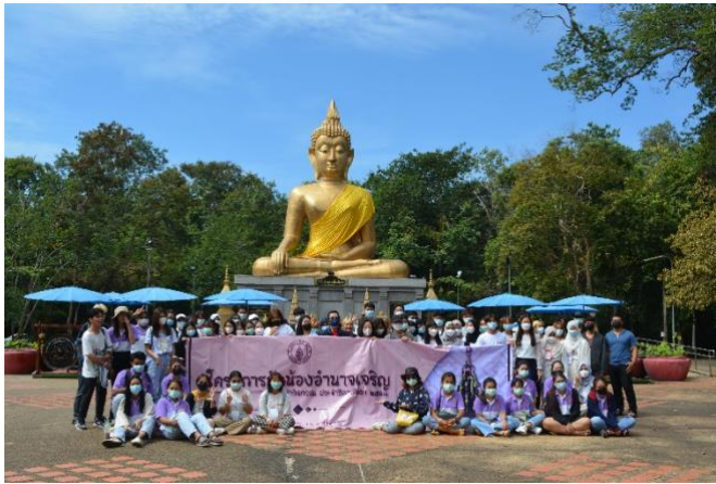
พระมงคลมิ่งเมือง พระคู่บ้านคู่เมืองอำนาจเจริญ