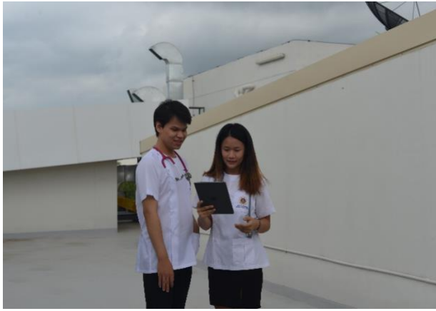
ชุดเสื้อกาวน์คอกลม