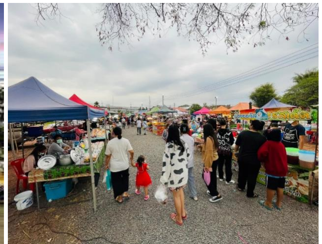
ถนนคนเดิน หน้าโรงพยาบาลอำนาจเจริญทุกวันจันทร์ พุธ ศุกร์