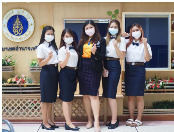
กะโปรงนักศึกษาหญิงแต่ละรูปแบบ