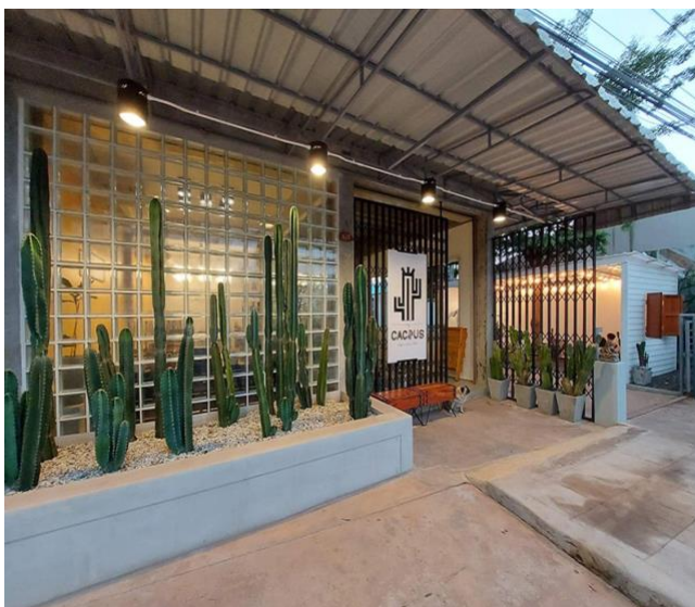
ร้าน Cactus ถนนกลางเมือง เลย์แยกไฟแดง Big C