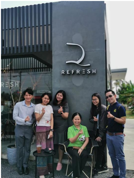
คาเฟ่รุ่นพี่ รหัส ๕๘ ที่หันมาเอาดีทางบาร์ิสต้า