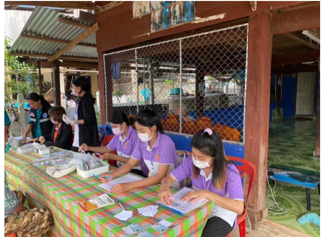
ชุดสำหรับทำกิจกรรมในชุมชน