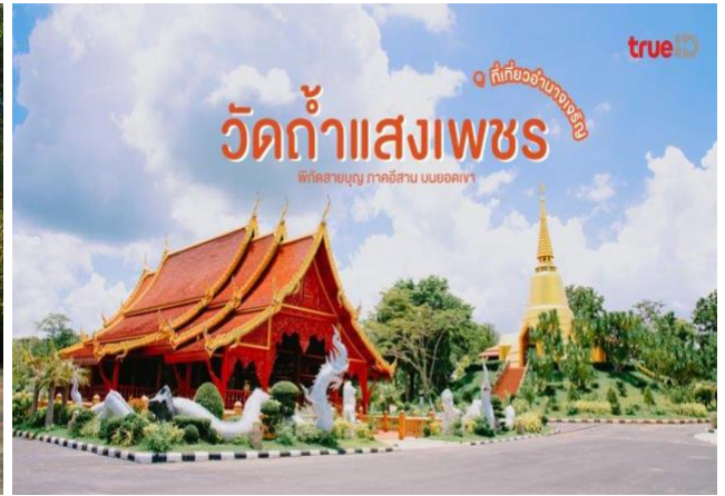
วัดถ้ำแสงเพชร ความสงบท่ามกลางธรรมชาติ