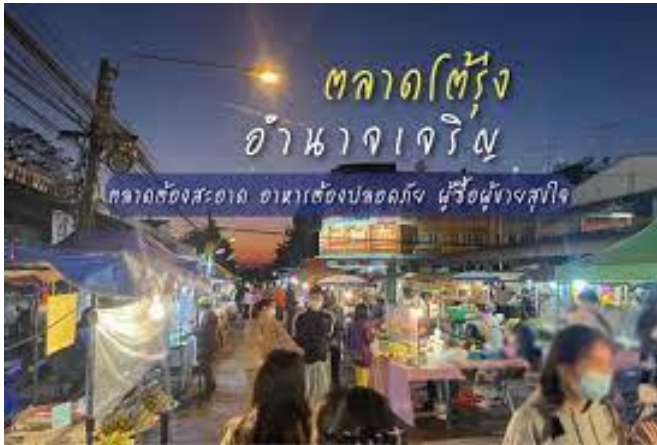
ตลาดไทรทองเรียงข้างที่ว่าการอำเภอเมือง