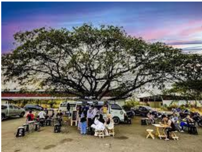
ถนนคนเดิน หน้าโรงพยาบาลอำนาจเจริญทุกวันจันทร์ พุธ ศุกร์