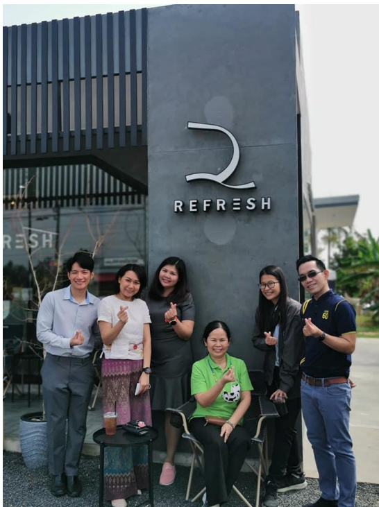
คาเฟ่รุ่นพี่ รหัส ๕๘ ที่หันมาเอาดีทางบาร์ิสต้า