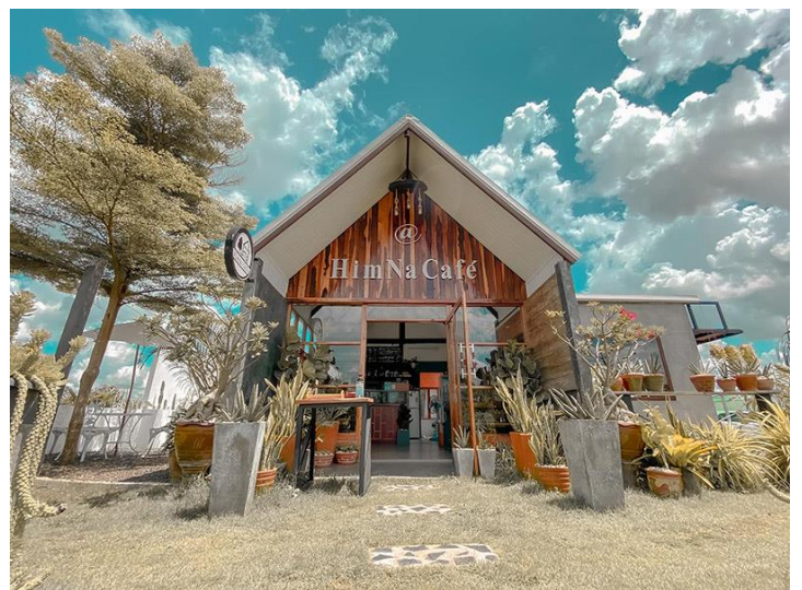
ออกนอกตัวเมืองไปก็มีคาเฟ่บรรยากาศดีๆ ที่ Himna