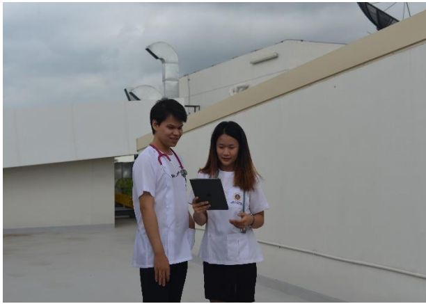
ชุดเสื้อกาวน์คอกลม

๒. กรณีเรียนในห้องปฏิบัติการ ปฏิบัติตามข้อปฏิบัติของห้องปฏิบัติการ โดยสวมเสื้อกาวน์ยาวทับซ้อนชุดที่ใส่ในวันนั้นๆ