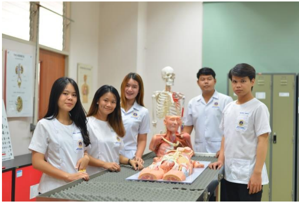
ชุดเสื้อกาวน์คอกลม และคอปก