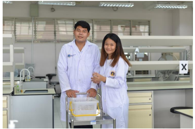
ชุดปฏิบัติการ