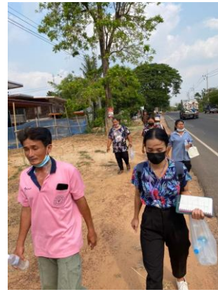
ชุดสุภาพ