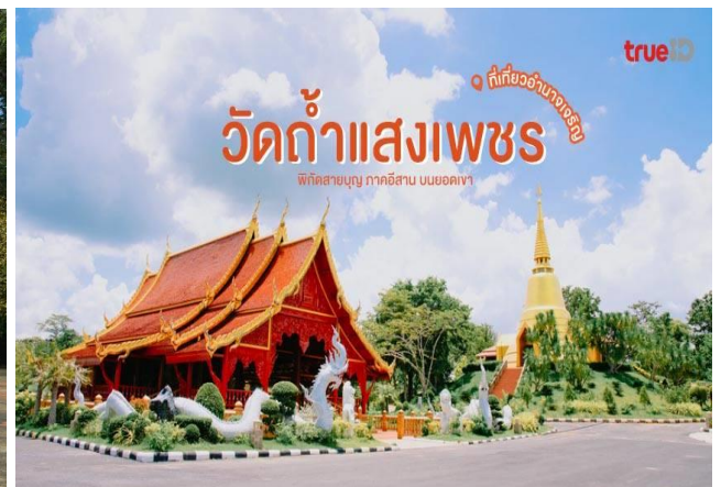
วัดกำแพงเพชร ความสงบท่ามกลางธรรมชาติ