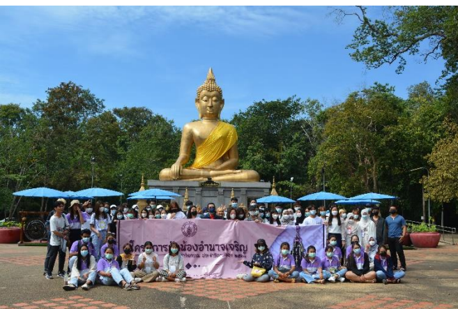
พระมงคลมิ่งเมือง พระคู่บ้านคู่เมืองอำนาจเจริญ