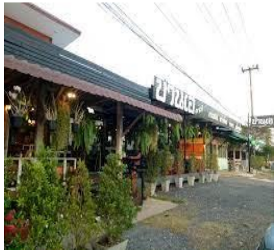
ร้านอาหารแนวชิๆ มีทีเชลฟ์สวยๆ พร้อมด้วยเค้ก กาแฟ หลังโรงแรมฝ้ายขีด ร้านอาหารบ้านเอ ระหว่างเส้นทางเป็นศูนย์เรียนรู้ดั่งบังอี่