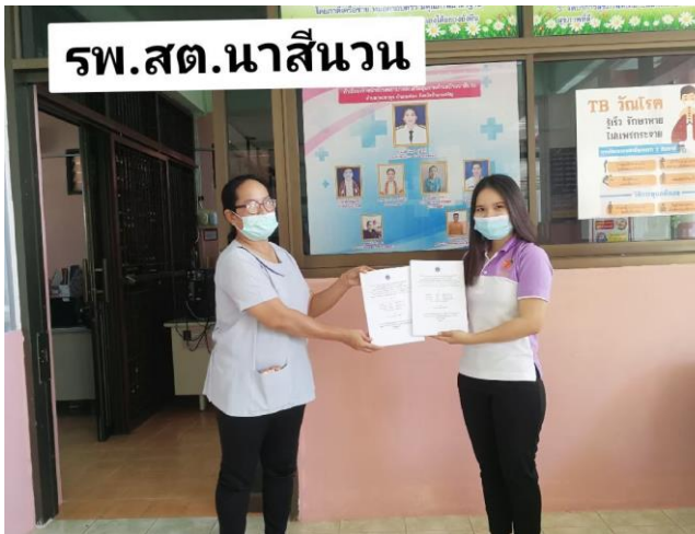
ชุดสำหรับทำกิจกรรมในชุมชน

๒. ฝึกประสบการณ์วิชาชีพสาธารณสุข นักศึกษาสามารถใส่เสื้อกาวน์คอปก เสื้อกาวน์คอกลม ชุดนักศึกษา ชุดสุภาพกรณีทำกิจกรรมในชุมชน หรือชุดตามข้อปฏิบัติของแหล่งฝึกได้